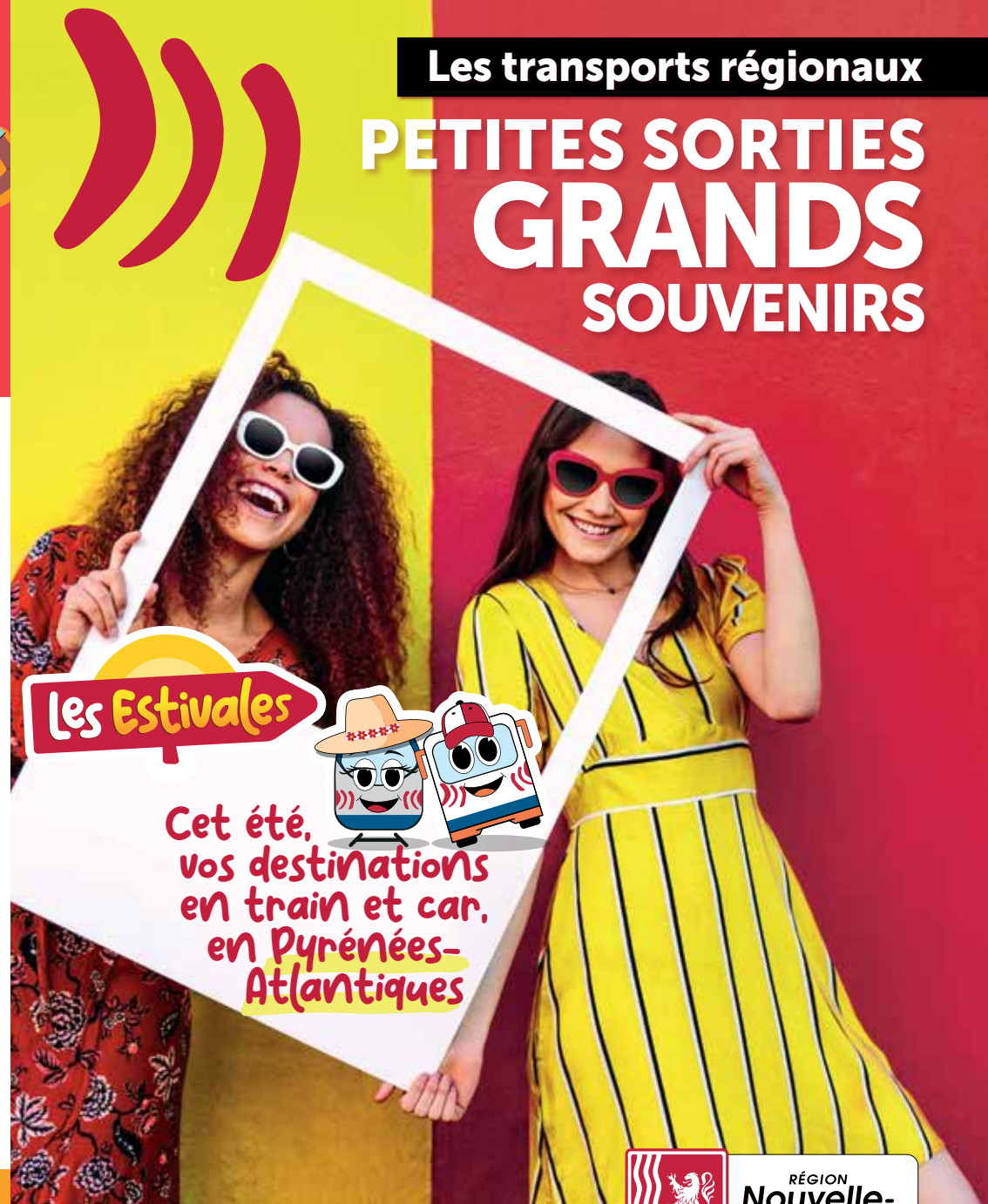
Illustration : Composit - Conception : vitamine® - 06/25